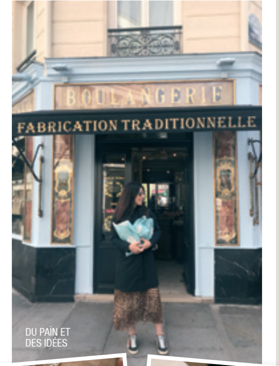
DU PAIN ET DES IDÉES

Paris'in ilk dijital sanat müzesi olan L'Atelier des Lumières'de 6 Ocak 2019'a kadar Gustav Klimt'in eserleri dev projeksiyonla duvarlara yansıtılarak sergileniyor. Önceleri dökümhane olan bu alanda daha önce bir sergi gezme fırsatı bulamadıysanız bu kez kaçırmayın. Yine 6 Ocak'a kadar Musée d'Orsay'da Picasso'nun sanatında önemli altı yılını anlatan "Mavi ve Gül" sergisini de görebilirsiniz. Fondation Louis Vuitton ise 14 Ocak'a kadar Amerikalı graffit sanatçısı Jean-Michel Basquiat'ın 120 eserinin bulunduğu retrospektif sergisini ağırlayacak. 🇫🇷