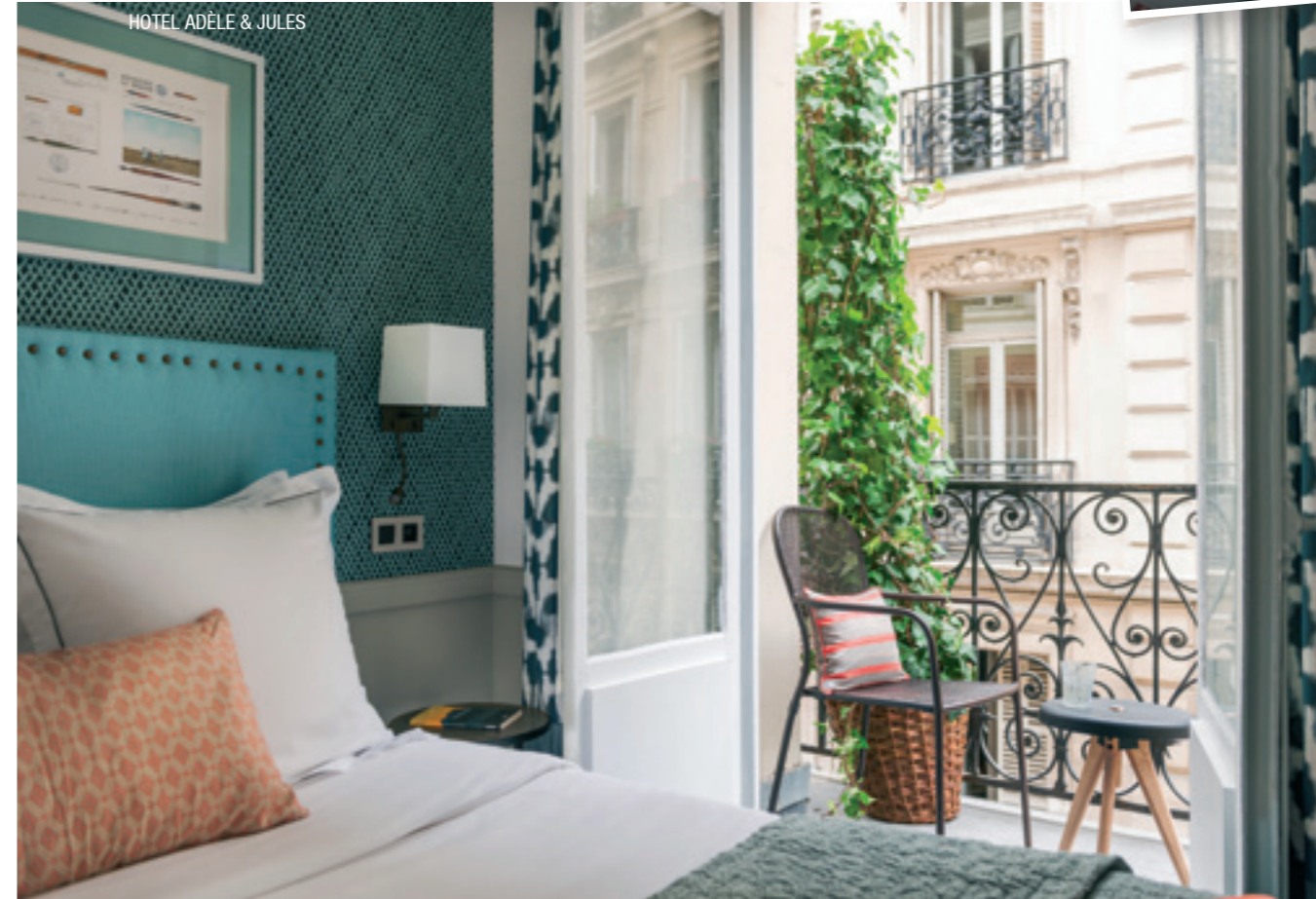
HOTEL ADELE & JULES